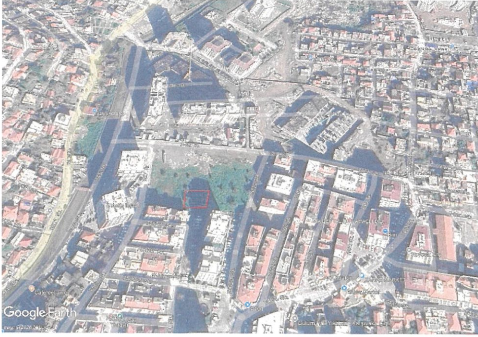
Şekil 1: Uydu Görüntüsü

Plan değişikliğine konu alan kamuya terkli alan olup, park alanı olarak planlıdır.