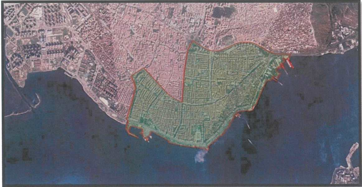
Şekil 1:Karşıyaka 1.Etap Uygulama İmar Planı Revizyonu -Plan Sınırı