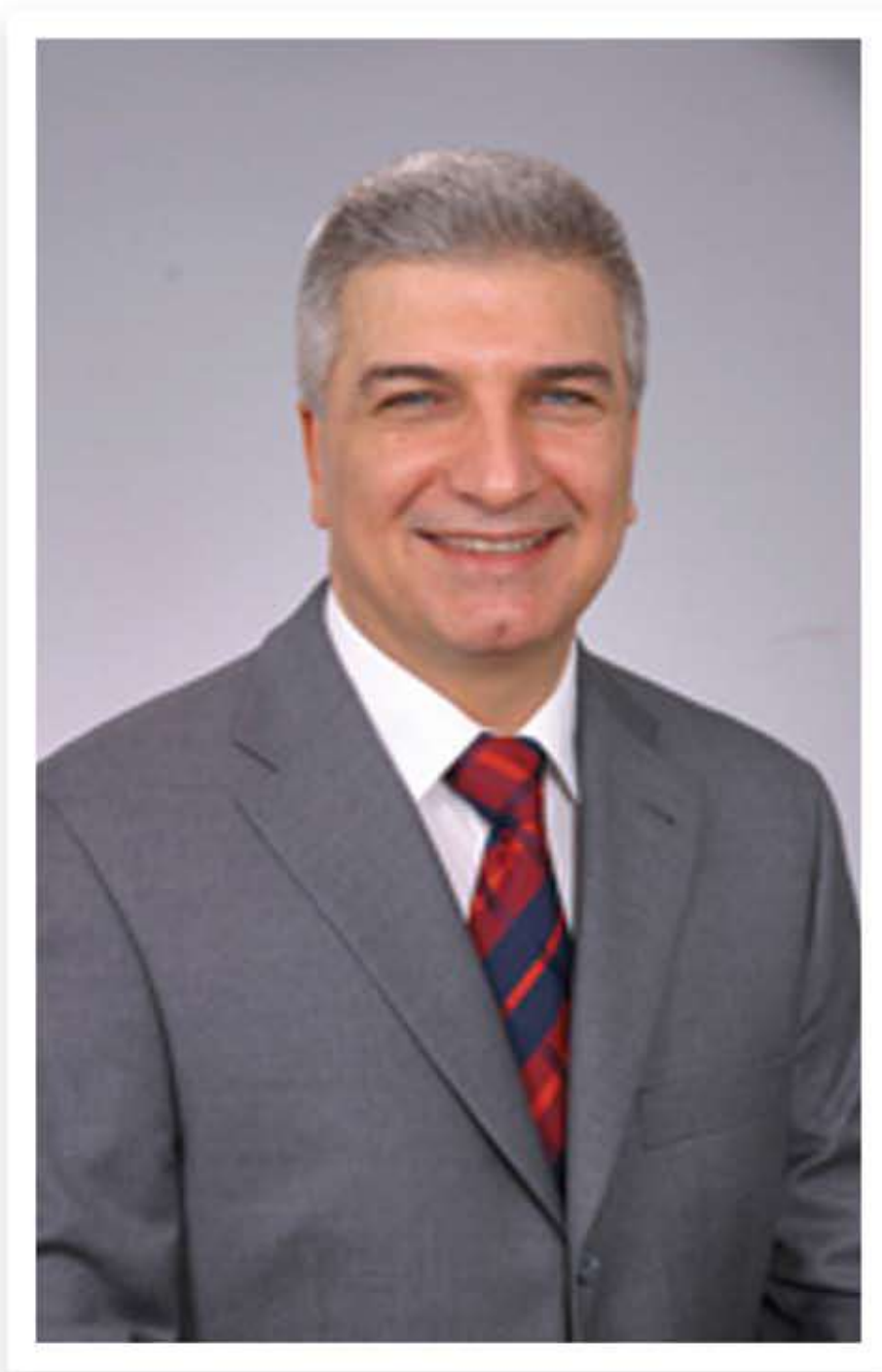
Cevat DURAK İzmir Karşıyaka Belediye Başkanı