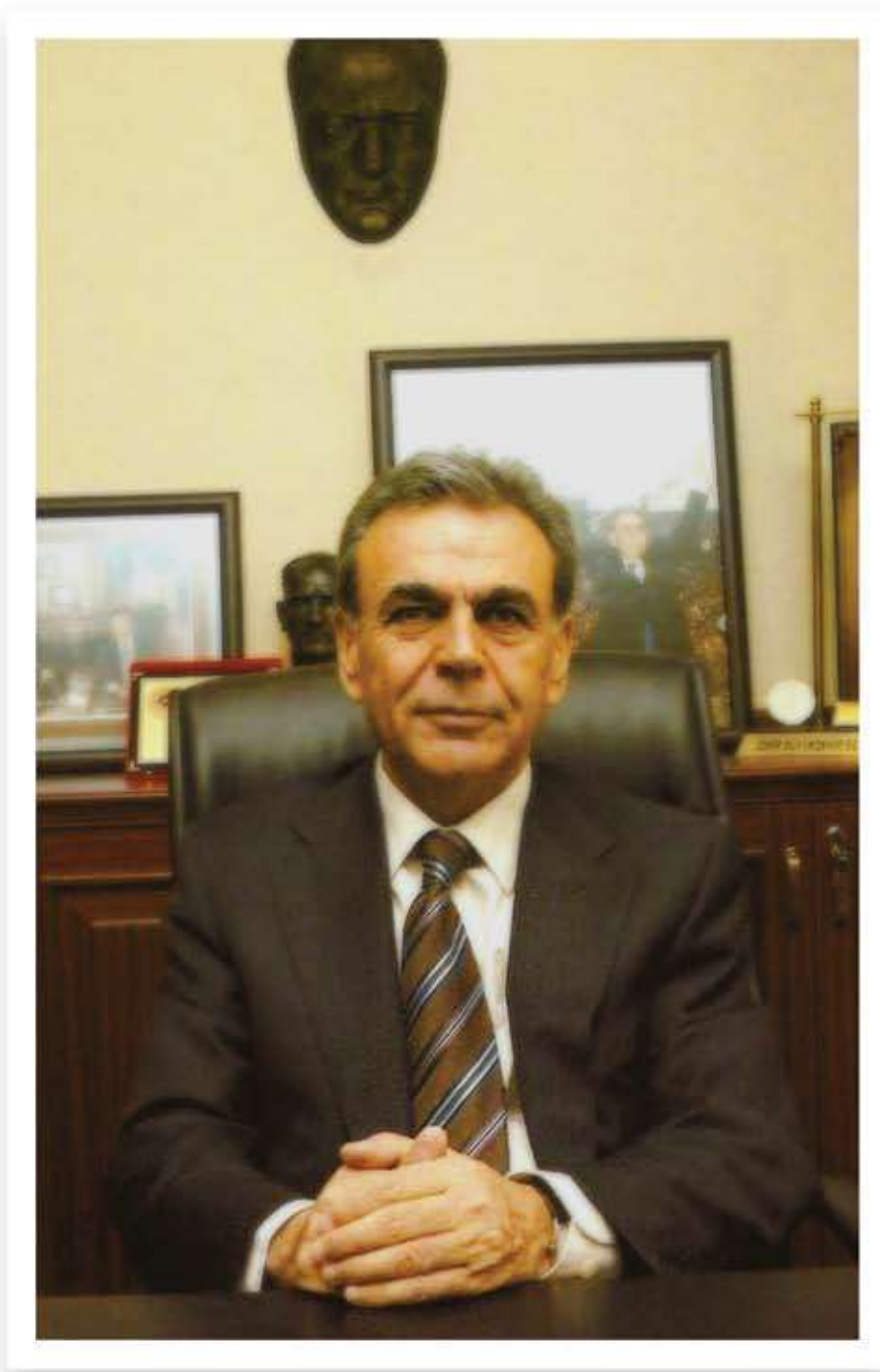
Aziz KOCAOĞLU İzmir Büyükşehir Belediyesi Başkanı