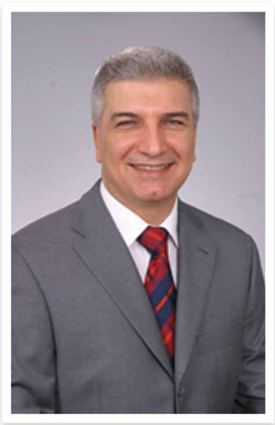
Cevat DURAK İzmir Karşıyaka Belediye Başkanı