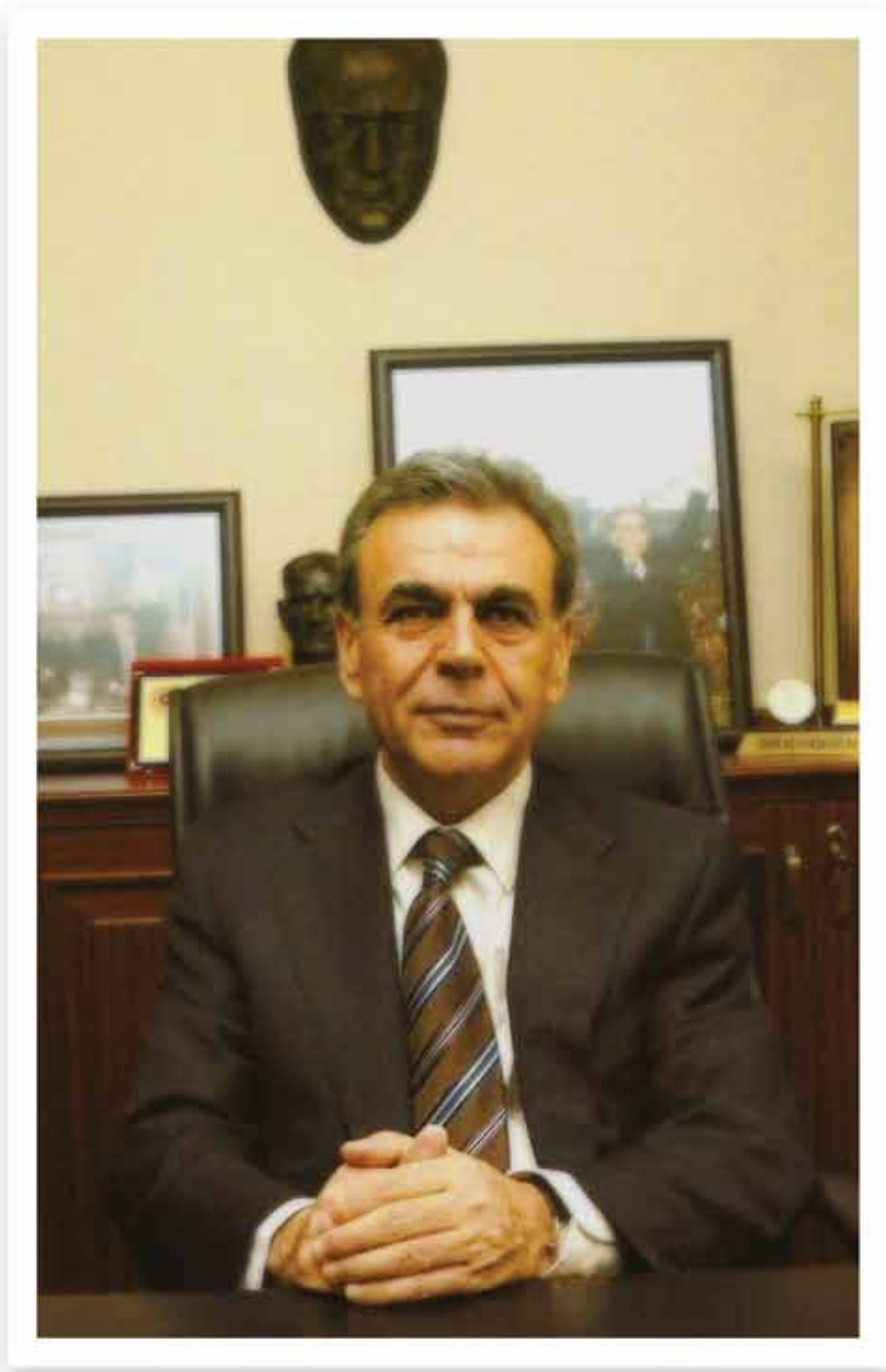
Aziz KOCAOĞLU İzmir Büyükşehir Belediyesi Başkanı