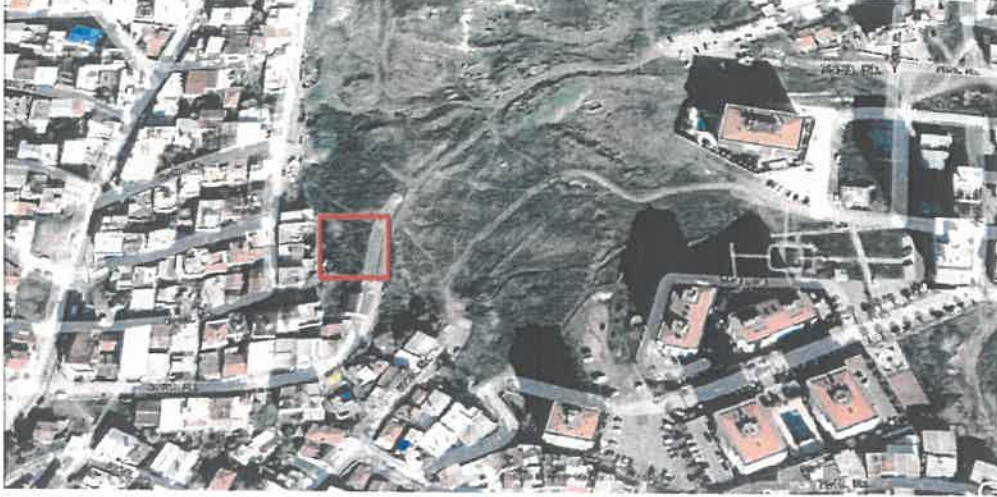
Şekil 1: İmar planı Değişikliği Alanının Uydu Görüntüsü

İmar Planı Değişikliğine konu olan, İzmir İli, Karşıyaka İlçesi, Çiğli-Mahallesi,26L-3A Nolu imar paftasında bulunmaktadır.6731 Sokak ile 6733 Sokak birleşiminde kalan yeşil alan sınırları içerisinde 10.00x6.00 ebatlı, 60 m2 yüzölçümlü trafo konumlandırılmıştır.