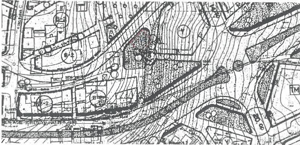
Şekil 2: Uygulama İmar Planındaki Konumu

S&M TUNTAŞ Planlama Ltd.Şti. Oda Sicil No: 2044 O.D.T.Ü. Çiftçiöğlü Pasajı No: 310 - SÖKE Tel: (0 256) 5 2 81 47 Cep: (0 532) 2 11 49 16