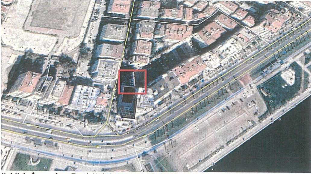
Şekil 1: İmar planı Değişikliği Alanının Uydu Görüntüsü

İmar Planı Değişikliğine konu olan, İzmir İli, Karşıyaka İlçesi, Donanmacı Mahallesi,24L-2B Nolu imar paftasında bulunmaktadır.1743 Sokak girişinde bulunan trafonun büyütülmesi kararı İ.B.B.nin kararına bırakılmıştır. 10.00x4.00 ebatlı, 40 m2 yüzölçümlü trafo konumlandırılmıştır.