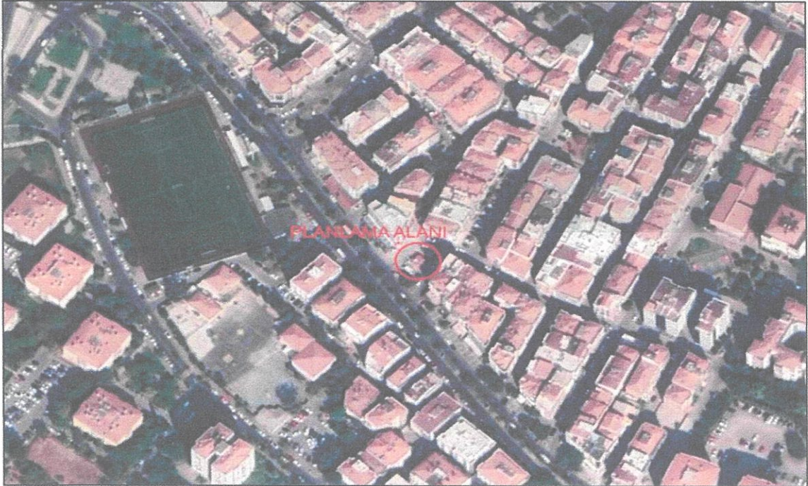
-Planlama Alanı Uydu Görüntüsü (yakın)-