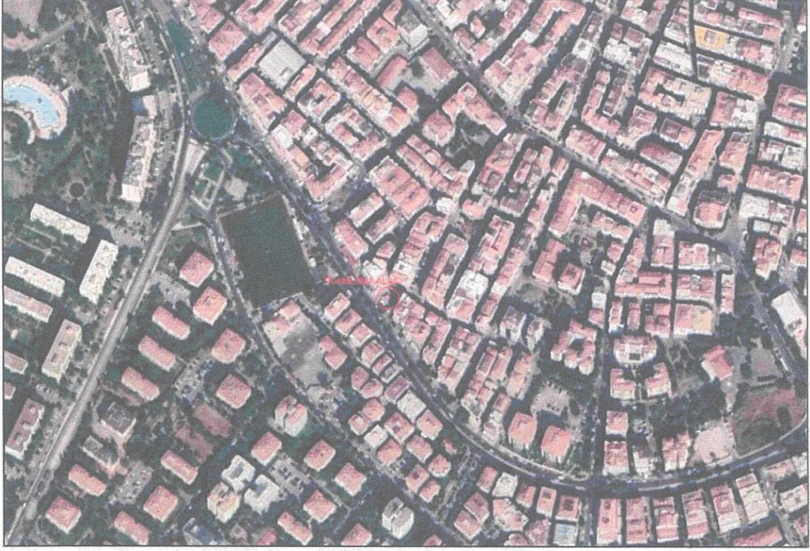
-Planlama Alanı Uydu Görüntüsü (uzak)-

Planlama alanı; teklifi İzmir ili, Karşıyaka ilçesi, Şemikler Mahallesi, 25L1C Pafta, 26788 ada, 1 parselde bulunan Trafo Alanına, 5.51 m x 5.71 m ebatlarında \cong 31.27 m 2 alana sahip Trafo Alanını kapsamaktadır.